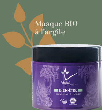
Masque BIO à l'argile

Les mélanges demandent une technique particulière à réaliser par un professionnel formé, tout comme la pose puisque l'application se fait par méthode cataplasme, mèche par mèche. Pour obtenir un résultat homogène et un rendu optimal, il est vivement conseillé de réaliser sa couleur en salon de coiffure.